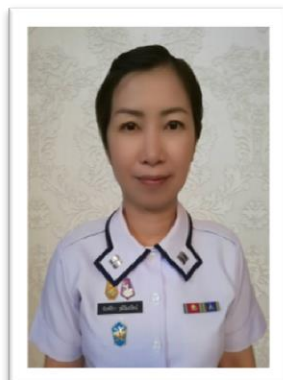
ภาพประกอบที่ ๓ การประดับเข็มมากกว่า ๑