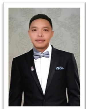
ภาพประกอบที่ ๔ การแต่งกายสากล