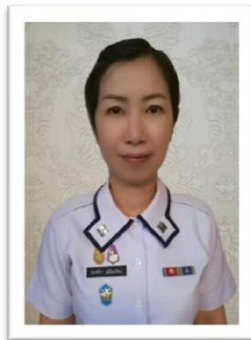
ภาพประกอบที่ ๓ การประดับเข็มมากกว่า ๑