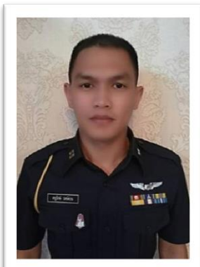
ภาพประกอบที่ ๑ เครื่องแบบปฏิบัติงานแบบมี